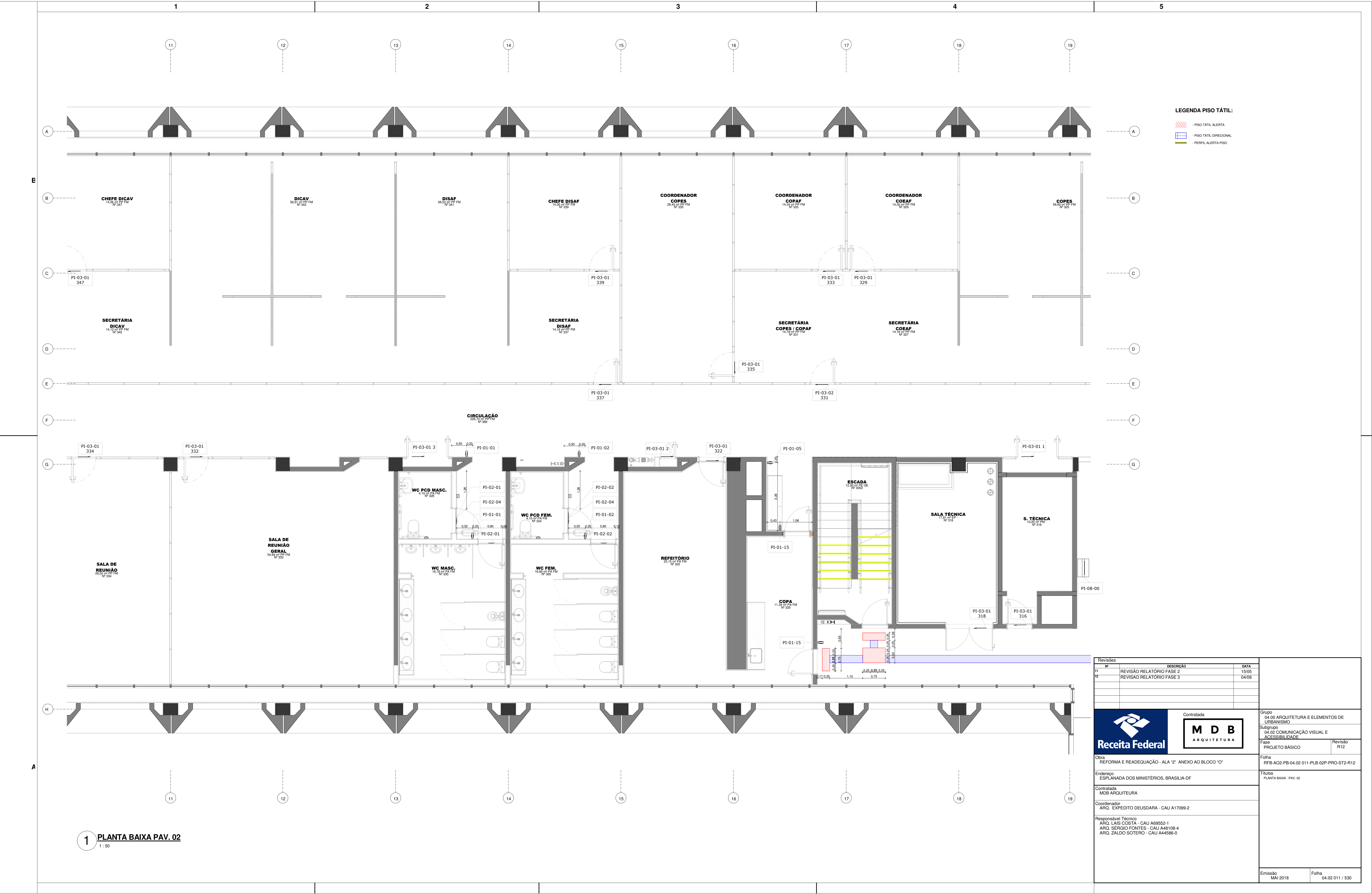
1 PLANTA BAIXA PAV. 02 1 : 50